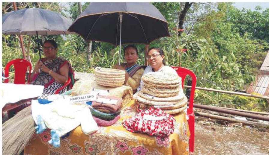
ସୁୟା ସହାୟକ ଗୋଷ୍ଠୀକ ଦ୍ୱାରା ପ୍ରସ୍ତୁତ ସାମଗ୍ରୀ

ଗ୍ରାମସଭା ଜରିଆରେ ଏହି ଐକ୍ୟବଦ୍ଧ ଆୟୋଜନ ନୁଆ ଗ୍ରାମପଞ୍ଚାୟତ ଭାବେ ମାନ୍ୟତା ପାଇଥିବା ସିକିମ୍ ର ଅନ୍ୟ ଗ୍ରାମପଞ୍ଚାୟତ ଗୁଡିକ ପାଇଁ ଅନୁକରଣୀୟ ଓ ପ୍ରେରଣାବାହକ । ମାତ୍ର ୩-୪ ବର୍ଷ ମଧ୍ୟରେ ଗ୍ରାମପଞ୍ଚାୟତ ଯେଉଁ ସଫଳତାର ସାଧନ ଅତିକ୍ରମ କରିଛି ତାହା କେବଳ ନବ ନିର୍ବାଚିତ ପ୍ରତିନିଧି, କର୍ମକର୍ତ୍ତା ଓ ଲୋକଙ୍କ ସକ୍ରିୟ ସହଯୋଗ ଯୋଗୁଁ ସମ୍ଭବ ହୋଇପାରିଛି । ଦକ୍ଷତା ବିକାଶ ତାଲିମ ମାଧ୍ୟମରେ ଯୁବବର୍ଗଙ୍କ ଅନ୍ତର୍ନିହିତ ପ୍ରତିଭାର ବିକାଶ ଘଟାଇ ସେମାନଙ୍କୁ ରୋଜଗାର ଯୋଗାଇବା ପାଇଁ ପ୍ରଶାସନର ପ୍ରୟାସ ପ୍ରଗତି ଧାରାର ଏକ ନୁଆ ଦିଗନ୍ତ ।