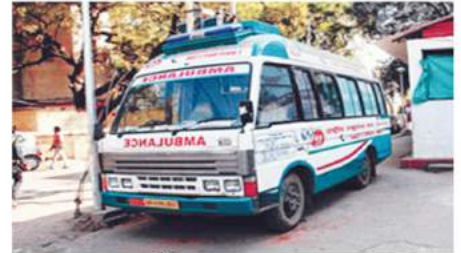
କାର୍ଯ୍ୟରତ ୧୦୮ ଆମ୍ବୁଲାନ୍ସ

ରାଜ୍ୟରେ ସ୍ୱାସ୍ଥ୍ୟସେବାର ଚିତ୍ର ବଦଳିଛି । ଶିଶୁ ଓ ମାତୃ ମୃତ୍ୟୁହାର କମିଛି । ଓଡ଼ିଶାରେ ଏବେ ଶିଶୁ ମୃତ୍ୟୁହାର ଜାତୀୟ ହାରଠାରୁ କମ୍ ରହିଛି । ଜାତୀୟ ସ୍ତରରେ ଏହା ପ୍ରତି ହଜାରେ ଜନ୍ମିତ ଶିଶୁରେ ମୃତ୍ୟୁ ସଂଖ୍ୟା ୪୧ ଥିବା ବେଳେ ଓଡ଼ିଶାରେ ଏହା ୪୦କୁ କମିଛି । ପ୍ରତିବର୍ଷ ୫୧ ହଜାର ଶିଶୁଙ୍କ ଜୀବନ ରକ୍ଷା କରାଯାଇପାରୁଛି । ଆନୁଷ୍ଠାନିକ ପ୍ରସବ ହାର ୮୫ ପ୍ରତିଶତରେ ପହଞ୍ଚିଥିବା ବେଳେ ଚିକାକରଣ ହାର ୭୮.୫ ପ୍ରତିଶତରେ ପହଞ୍ଚିଛି । ଶିଶୁ ଓ ମାତୃ ମୃତ୍ୟୁ ପ୍ରସବ ୧୫ଟି ଜିଲ୍ଲାରେ ମୃତ୍ୟୁ ହାର କମାଇବା ପାଇଁ ସ୍ୱତନ୍ତ୍ର ଯୋଜନା ମାଧ୍ୟମରେ ୨୧୧ କୋଟି ଟଙ୍କାର ବ୍ୟବସ୍ଥା ହୋଇଛି । ରାଷ୍ଟ୍ରୀୟ ବାଲ୍ ସ୍ୱାସ୍ଥ୍ୟ କାର୍ଯ୍ୟକ୍ରମରେ ଗତ ୩ ବର୍ଷରେ ୮୦ ଲକ୍ଷରୁ ଊର୍ଦ୍ଧ୍ୱ ବାଳକ ବାଳିକାଙ୍କୁ ଭ୍ରାମ୍ୟମାଣ ସ୍ୱାସ୍ଥ୍ୟ ଚିମନୀରୁ ଦ୍ୱାରା ସ୍ୱାସ୍ଥ୍ୟ ପରୀକ୍ଷା କରାଯାଇଛି । ଗତ ୩ବର୍ଷରେ ମେଡିକାଲ କଲେଜରେ ସିଟ୍ ସଂଖ୍ୟା ୪୫୦ରୁ ୮୫୦କୁ ବୃଦ୍ଧି । ଚଳିତବର୍ଷ ଦୁଇଟି ନୂଆ ମେଡିକାଲ କଲେଜ ଖୋଲିବାକୁ ଯାଉଛି । ପିଜି ସିଟ୍ ସଂଖ୍ୟା ପଞ୍ଚବର୍ଷରେ ୧୧୮୦ ବୃଦ୍ଧି କରାଯାଇଛି । ନିରାମୟ ଯୋଜନାରେ ୪୦୦ ପ୍ରକାର ଔଷଧ ଦିଆଯାଉଛି । ଏଥିପାଇଁ ଚଳିତବର୍ଷ ୨୫୦ କୋଟି ଟଙ୍କାର ବଜେଟ୍ ହୋଇଛି । ରାଜ୍ୟରେ ୧କୋଟି ୩୩ ଲକ୍ଷ ରୋଗୀ ମାରଣୀ ଔଷଧ ମାଧ୍ୟମରେ ଉପକୃତ ହୋଇଛନ୍ତି । ରକ୍ତଦାନ ସେବା ସୁଦୃଢୀକରଣ ପାଇଁ ୧୨୮.୮୭ କୋଟି ଟଙ୍କାର ବଜେଟ୍ ହୋଇଛି ଏବଂ ସ୍ୱେଚ୍ଛାକୃତ ରକ୍ତଦାନ ସୁବିଧା ପାଇଁ ୯ଟି ରକ୍ତସଂଗ୍ରହ ଭ୍ରାମ୍ୟମାଣ ଯାନ ଓ ରକ୍ତର ବିଶେଷ ବ୍ୟବହାର ପାଇଁ ୧୧ଟି ରକ୍ତ ବିଭାଜନ କେନ୍ଦ୍ର ଖୁବଶୀଘ୍ର ପ୍ରତିଷ୍ଠା ହେବାକୁ ଯାଉଛି । ୩ ବର୍ଷରେ ୧୨.୬ ଲକ୍ଷ ଯୁନିଟ୍ ରକ୍ତ ସଂଗ୍ରହ ହୋଇଛି । ରୋଗୀ ଅନୁପାତରେ ଡାକ୍ତର ନଥିବା ସମସ୍ୟା ସୁଧାରିବା ପାଇଁ ଚଳିତବର୍ଷ