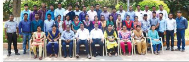
ପ୍ରଶିକ୍ଷକଙ୍କ ସହ ନବନିଯୁକ୍ତ ଗ୍ରାମପଞ୍ଚାୟତ ସମ୍ପ୍ରସାରଣ ଅଧିକାରୀ

ଏହି କାର୍ଯ୍ୟକ୍ରମରେ ପଞ୍ଚାୟତିରାଜ ବ୍ୟବସ୍ଥା, ସରକାରୀ କର୍ମଚାରୀଙ୍କ ଆଚାର ସଂହିତା, ସୂଚନା ଅଧିକାର ଆଇନ, ମହାତ୍ମା ଗାନ୍ଧି ନରେଗା, ଗ୍ରାମ୍ୟ ଗୃହ ନିର୍ମାଣ, ଓଡ଼ିଶା ଜାବିକା ମିଶନ ଓ ଗ୍ରାମ ପଞ୍ଚାୟତ ବିକାଶ ଯୋଜନା ଭଳି ବହୁ ଉପାଦେୟ ବିଷୟ ଉପରେ ପଞ୍ଚାୟତିରାଜ ଓ ପାନୀୟଜଳ ବିଭାଗର ବରିଷ୍ଠ ଅଧିକାରୀ ଏବଂ ରାଜ୍ୟ ଗ୍ରାମ୍ୟଉନ୍ନୟନ ଓ ପଞ୍ଚାୟତିରାଜ ପ୍ରତିଷ୍ଠାନର ପ୍ରଶିକ୍ଷକମାନେ ଆଲୋକପାତ କରିଥିଲେ ।