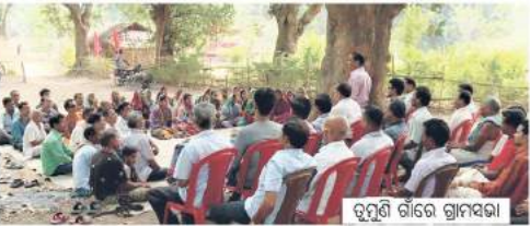
ତୁମୁଣି ଗାଁରେ ଗ୍ରାମସଭା

ସରସ୍ୱ ପୁରର ଗାଁ ଗଢ଼ିବାରେ ସ୍ଥାନୀୟ ବାସିନ୍ଦା ଗୁରୁତ୍ୱପୂର୍ଣ୍ଣ ଭୂମିକା ଗ୍ରହଣ କରିଅଛନ୍ତି । ଗ୍ରାମବାସୀ ନିଜେ ପୁସ୍ତକ ବିକ୍ରିକାରୀ ଅନୁଶାସନକୁ ନିଷ୍ଠାର ସହ ମାନି ଚଳୁଥିବାରୁ ଆଖପାଖ ଅଞ୍ଚଳରେ ନିଜ ପାଇଁ ଏକ ସ୍ୱତନ୍ତ୍ର ପରିଚରଣ ସୃଷ୍ଟି କରିଛି ଅନୁଗୋଳ ଜିଲ୍ଲାର ବଡ଼ବେରା ପଞ୍ଚାୟତ ଅନ୍ତର୍ଗତ ତୁମୁଣି ଗାଁ । ଜାତିର ଜନକ ମହାତ୍ମା ଗାନ୍ଧିଙ୍କ ଗ୍ରାମସ୍ୱରାଜ ବାଦାଳୁ ତୁମୁଣିବାସୀ ନିଜ ଶୈଳୀରେ ଗ୍ରହଣ କରିନେଇଛନ୍ତି ।