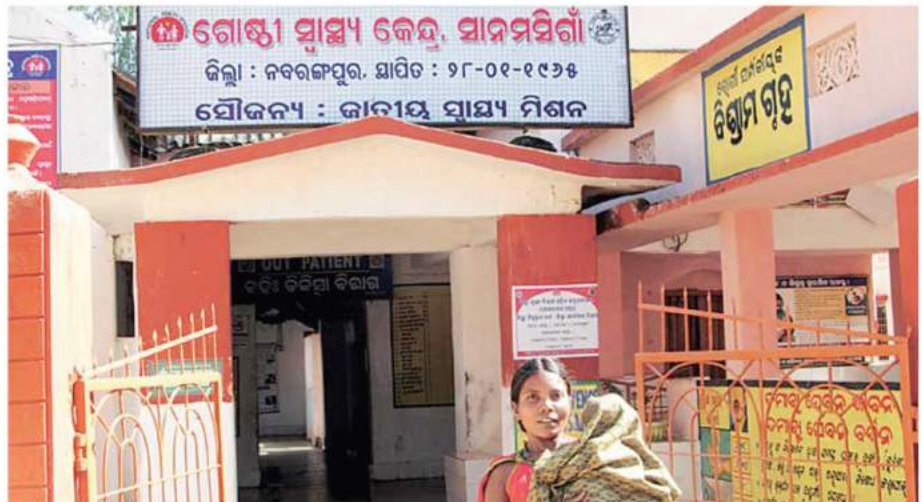
ନବରଙ୍ଗପୁର ଜିଲ୍ଲା ଅନ୍ତର୍ଗତ ସାନମସି ଗାଁର ଗୋଷ୍ଠୀ ସ୍ୱାସ୍ଥ୍ୟକେନ୍ଦ୍ର

ରାଜ୍ୟରେ ରେଫରାଲ ପରିବହନ ସେବା ପାଇଁ ୧୦୮ ଆମ୍ବୁଲାନ୍ସ ସଂଖ୍ୟା ୫୧୨କୁ ବୃଦ୍ଧି କରାଯାଇଛି । କ୍ୟାମ୍ପୋଲ ହସ୍ପିଟାଲ, କଟକ ବଡ଼ ମେଡିକାଲରେ ହସ୍ପିଟାଲ ମ୍ୟାନେଜମେଣ୍ଟ ଇନ୍‌ଫରମେସନ୍ ବ୍ୟବସ୍ଥା କାର୍ଯ୍ୟକାରୀ କରାଯିବାକୁ ପ୍ରସ୍ତାବ ରହିଛି । ସେବିକା ଶିକ୍ଷା ନିମନ୍ତେ ସେବିକା ନିର୍ଦ୍ଦେଶାଳୟ ପ୍ରତିଷ୍ଠାରେ ଓଡ଼ିଶା ହେଉଛି ଦେଶର ପ୍ରଥମ ରାଜ୍ୟ । ଏଥିସହିତ ରାଜ୍ୟର ୨୬ଟି ସ୍ଥାନରେ ସରକାରୀ ଓ ଘରୋଇ ସହଭାଗିତାରେ ମାରଣୀ ଡାଏଲିସିସ ଯୋଗାଇବାର ଯୋଜନା ରହିଛି । ଏହାଦ୍ୱାରା ଉଚ୍ଚ ରକ୍ତଚାପ, ମଧୁମେହ, ମୁଖଗହ୍ୱର କର୍କଟ ଇତ୍ୟାଦିର ସହଜ ଚିକିତ୍ସା ହୋଇପାରିବ ।