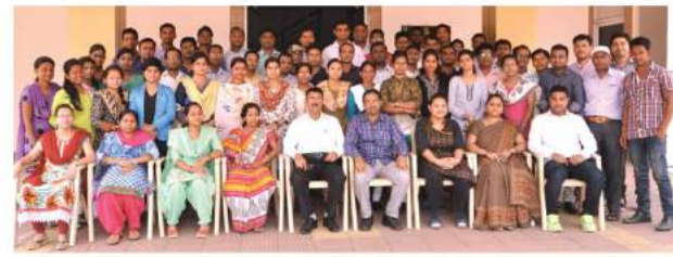
ପ୍ରଶିକ୍ଷକଙ୍କ ସହ ନବନିଯୁକ୍ତ ପ୍ରଗତି ସହାୟକ