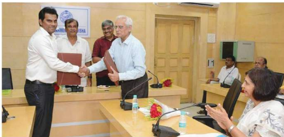
ଖଣ୍ଡଗିରି-ଉଦୟଗିରିରେ ଶାନ୍ତ ଗାନ୍ଧି ଶାନ୍ତି କେନ୍ଦ୍ର ପ୍ରତିଷ୍ଠା ପାଇଁ ଆଦିତ୍ୟ ବିର୍ଲା ଗ୍ରୁପ୍ ସହ ବୃତ୍ତିନାମା

ଓଡ଼ିଶାର ଅନ୍ୟାନ୍ୟ ଐତିହାସିକ ସ୍ଥଳ ଏବଂ ପର୍ଯ୍ୟଟନ କେନ୍ଦ୍ର ତୁଳନାରେ ଭୁବନେଶ୍ୱର ସ୍ଥିତ ଖଣ୍ଡଗିରି ଓ ଉଦୟଗିରି ଜୈନଗୁମ୍ଫାର ପରିଚୟ ସ୍ପଷ୍ଟ । ଆଗକୁ ଖଣ୍ଡଗିରି ଓ ଉଦୟଗିରି ବୁଲିବାକୁ ଆସି ପର୍ଯ୍ୟଟକମାନେ ଆମର ଐତିହ୍ୟ ଓ ଭାଷ୍ୟକୁ ଉପଭୋଗ କରିବା ସହ ମହାତ୍ମା ଗାନ୍ଧିଙ୍କ ସମ୍ପର୍କରେ ବି ବହୁ କିଛି ତଥ୍ୟ ଜାଣିବାକୁ ପାଇବେ । ଏହି ଉଦ୍ଦେଶ୍ୟରେ ଖଣ୍ଡଗିରି ଉଦୟଗିରି ବ୍ୟାଖ୍ୟାନ କେନ୍ଦ୍ରରେ ପ୍ରତିଷ୍ଠା ହେବାକୁ ଯାଉଛି ଶାନ୍ତ ଗାନ୍ଧି ଶାନ୍ତି କେନ୍ଦ୍ର । ଏହାର ପରିଚାଳନା ଦାୟିତ୍ୱ ରାଜ୍ୟ ପର୍ଯ୍ୟଟନ ବିଭାଗ ପକ୍ଷରୁ ଆଦିତ୍ୟ ବିର୍ଲା ଗ୍ରୁପ୍‌କୁ ଦିଆଯାଇଛି ।