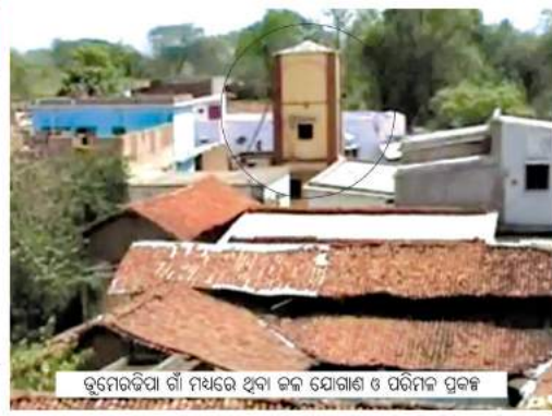
ତୁମେରଡ଼ିପା ଗାଁ ମଧ୍ୟରେ ଥିବା ବନ ଯୋଗାଣ ଓ ପରିମଳ ପ୍ରଦଳ

ଝାରସୁଗୁଡ଼ା ଜିଲ୍ଲା ଲଖନପୁର ବ୍ଲକର ତୁମେରଡ଼ିପା ଗାଁ । ଗ୍ରାମବାସୀଙ୍କ ସାମୁହିକ ଲୋକ ଆଦି ପ୍ରଥମେ ବସନ୍ତି ସ୍ଥାପନ ନିରାପଦ ପାନୀୟଜଳ ଯୋଗାଣ, ଘରେ ଘରେ କରିଥିଲେ ତୁମେରଡ଼ିପା ଗାଁରେ । ଏହି ଶୈଳୀର ନିର୍ମାଣ, ଭାରତର ତୁମ୍ଭି ଓ ବିଦ୍ୟାଳୟ ପ୍ରତିଷ୍ଠା ଏହି ଛୋଟିଆ ଗାଁକୁ ଏକ ଆଦର୍ଶ ଗାଁ ଭାବେ ରଚି ଚୋଳିଛି । ସବୁଠୁ ଜଣେବି ବ୍ୟାଙ୍କରୁ ରଣ ନେଇନାହାନ୍ତି ।