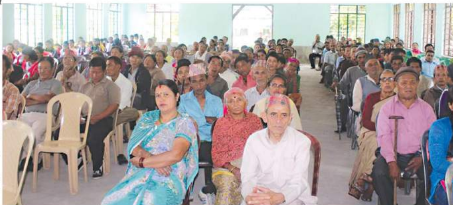
ସିକିମ୍ ରାଜ୍ୟର କୋଲିଆଙ୍ଗ ଟୋକଡେ ଗାଁରେ ଅନୁଷ୍ଠିତ ଗ୍ରାମସଭା

ନିୟମିତ ଗ୍ରାମସଭା ତକାଯାଇ ଲୋକଙ୍କ ଅଭାବ, ଅସୁବିଧା ସମ୍ବନ୍ଧରେ ଆଲୋଚନା କରାଯାଇ ସେସବୁର ପ୍ରତିକାର ପାଇଁ ଯୋଜନା ପ୍ରସ୍ତୁତ କରାଯାଉଛି । ପଞ୍ଚାୟତ ପ୍ରଶାସନ ତରଫରୁ ପ୍ରାଥମିକତା ଭିତ୍ତିରେ ପ୍ରତିଟି ଘରକୁ ବିଜୁଳି ଓ ନିରାପଦ ପାନୀୟ ଜଳ ଯୋଗାଣର ବ୍ୟବସ୍ଥା, ପାଇଖାନା ନିର୍ମାଣ, ଟିକାକରଣ ଓ ଦାରିଦ୍ର୍ୟ ସାମାନ୍ୟତା ତଳେ ବାସ କରୁଥିବା ସମସ୍ତ ପରିବାରର ଆର୍ଥିକ ବିକାଶ ପାଇଁ ଉଦ୍ୟମ ଆରମ୍ଭ ହୋଇଛି । ସମସ୍ତ ବିକାଶମୂଳକ