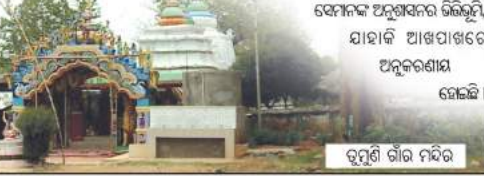
ତୁମୁଣି ଗାଁର ମନ୍ଦିର

ସେହିଭଳି ଖରାବିନେ ପାଣିର ଅଭାବ ଦୃଷ୍ଟିରୁ ସବୁ ପରିବାର ଧାଡ଼ି ବାନ୍ଧି ପୁରୁଟି ଲେଖାଏଁ ଗରା ବା ବାଲଟିରେ ନନକୁଅରୁ ପାଣି ଆଣିବାର ଶୁଖିଲା ବାସ୍ତବିକ ପ୍ରଶ୍ନସମାଧାନ ଦେବରକାରୀ ସଂଗଠନ ଫେଡ଼େରେସନ୍ ଅଫ୍ ଜକୋବିକାଲ ସୋସାଇଟି (FES) ସହଯୋଗରେ ତୁମୁଣି ଗାଁର ଲୋକେ ପାଖ ଜଙ୍ଗଲର ସୁରକ୍ଷା କରିବା ସହ ଗାଁର ଉନ୍ନତିରେ ପ୍ରକୃତ ଭାଗିଦାର ହୋଇପାରିଛନ୍ତି । ପ୍ରତ୍ୟେକ ପରିବାର ବର୍ଷକୁ ୫୦ଟକା ରେଖାଏଁ କର୍ମିନିକୁ ବେଇଅଛି । ଏହୁ ଅର୍ଥର ଉପଯୋଗ ସାଙ୍ଗକୁ ଗ୍ରାମବାସୀ କରା ଗାଁ ଲୋକେ ବେଶ୍ ବିକ୍ରି ଆଖୁଦୁଣିଆ କାମ କରିପାରିଛନ୍ତି । ଗାଁ ପୋଳ ନିକଟରେ ସଂଯୋଗକାରୀ ରାସ୍ତାର