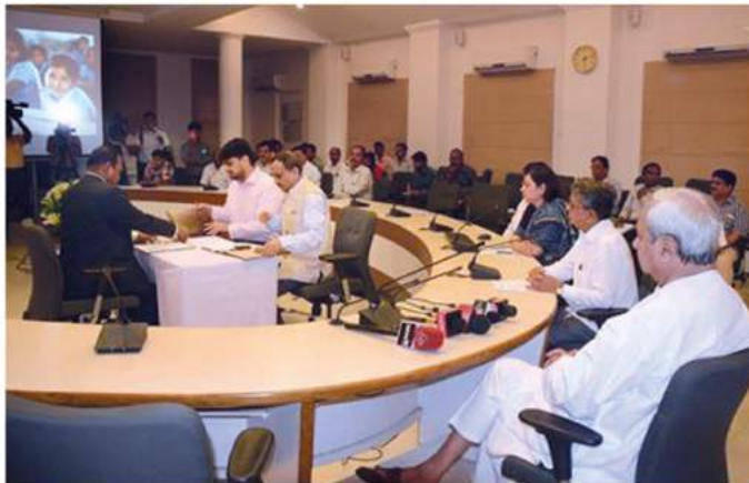
ରାଜ୍ୟରେ ଶିକ୍ଷାର ଗୁଣାତ୍ମକ ମାନ ବୃଦ୍ଧି ପାଇଁ ମୁଖ୍ୟମନ୍ତ୍ରୀଙ୍କ ଉପସ୍ଥିତିରେ ଅକ୍ଷରା ଓ କୁସୁମ ଫାଉଣ୍ଡେସନ୍ ସହ ବୁଝାମଣାପତ୍ର ସ୍ୱାକ୍ଷର