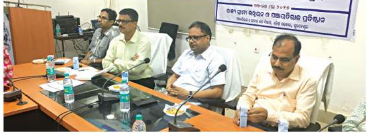
ନବନିଯୁକ୍ତ ଅଧିକାରୀଙ୍କ କର୍ମଶାଳାରେ ବିଭାଗୀୟ ସଚିବ, ନିର୍ଦ୍ଦେଶକ ଓ ଅନ୍ୟ ଅଧିକାରୀମାନେ

ନବନିଯୁକ୍ତ ଗ୍ରାମପଞ୍ଚାୟତ ସମ୍ପ୍ରସାରଣ ଅଧିକାରୀ ଓ ପ୍ରଗତି ସହାୟକଙ୍କ ପାଇଁ ଚାରିଦିନିଆ ପ୍ରାରମ୍ଭିକ ପ୍ରଶିକ୍ଷଣ କାର୍ଯ୍ୟକ୍ରମ ଭୁବନେଶ୍ୱରସ୍ଥିତ ରାଜ୍ୟ ଗ୍ରାମ୍ୟ ଉନ୍ନୟନ ଓ ପଞ୍ଚାୟତିରାଜ ପ୍ରତିଷ୍ଠାନଠାରେ ନିକଟରେ ଅନୁଷ୍ଠିତ ହୋଇଯାଇଛି ।